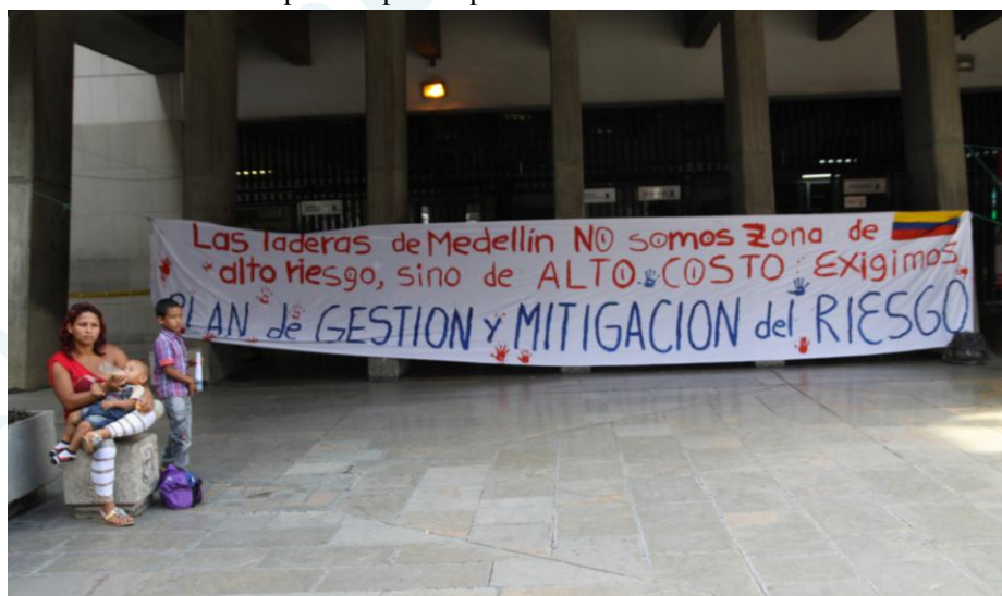
Movilización en protesta por la aprobación del POT. 27 de octubre 2014