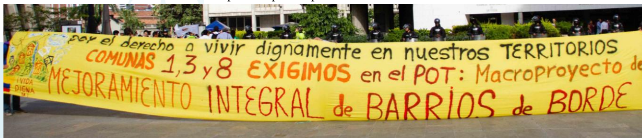
Movilización en protesta por la aprobación del POT. 27 de octubre 2014